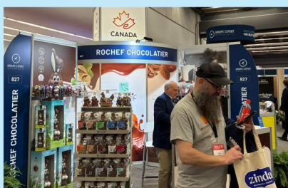
Монголын хүнс үйлдвэрлэгчид Хойд Америкийн хамгийн том үзэсгэлэн "SIAL CANADA"-д оролцлоо