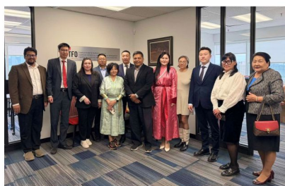
Монгол-Канадын бизнесийн хамтын ажиллагааны шинэ гарцуудыг судаллаа