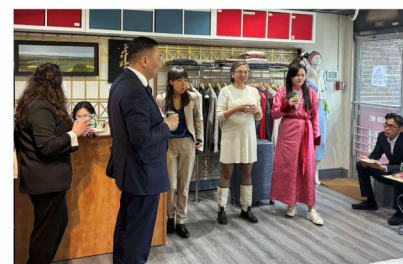
Канад улсад үйл ажиллагаа явуулж буй "CASHMERE CASA" дэлгүүртэй танилцлаа