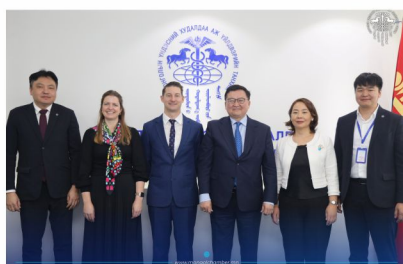
МҮХАҮТ болон Олон Улсын Хөдөлмөрийн байгууллага хамтын ажиллагааны уулзалт хийлээ