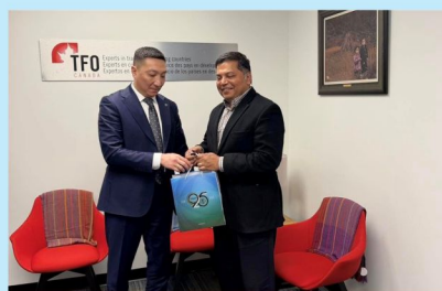
МҮХАҮТ, Канадын TFO байгууллага хоорондын хамтын ажиллагааг өргөжүүлнэ