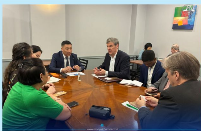
Монреал дахь Өргөмжит Консул Пол Лэмитэй уулзалт хийлээ