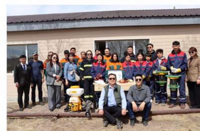
Хосмог сургалтыг танилцуулах, Төр-Хувийн хэвшлийн түншлэлийг бэхжүүлэх өдөрлөг амжилттай зохион байгуулагдлаа