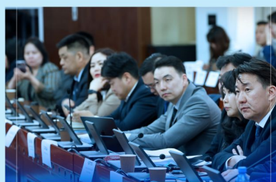
Худалдаа Аж Үйлдвэрийн Танхимын тухай хуулийн шинэчлэл – бизнесийн орчинд юу өөрчлөгдөх вэ?